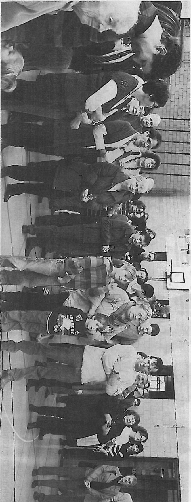
Die Neujahrgäste in Freienwil lauschen den Worten ihres Gemeindevorstehers und dem Gesang des Männerchors.

Natürlich machte sich der Gemeindevorsteher bei den Sängern des Männerchors