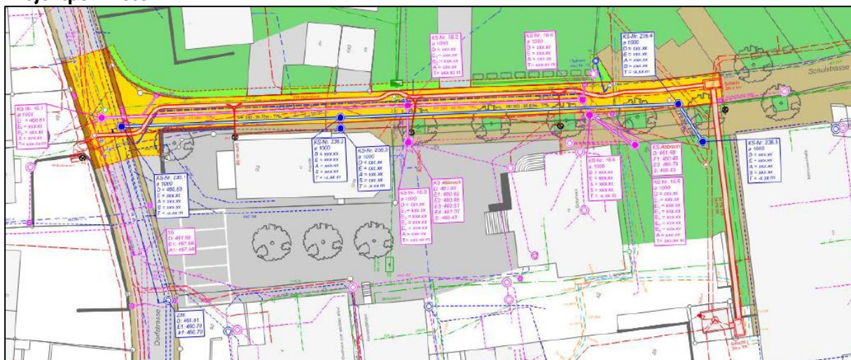
Ausschnitt Projektperimeter Schulstrasse